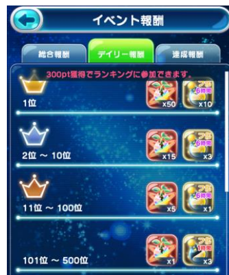
デイリーランキング報酬