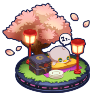
ポイント達成報酬

他のユーザーと獲得ポイントを競う総合ランキングやデイリーランキングも同時開催! 総合ランキング50位以内で、春爛漫な宇宙船「サクラザカリ」をGETできます! 上位を目指し、たくさんの報酬を手に入れよう!