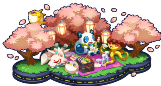
総合ランキング報酬