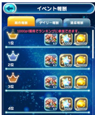
総合ランキング報酬